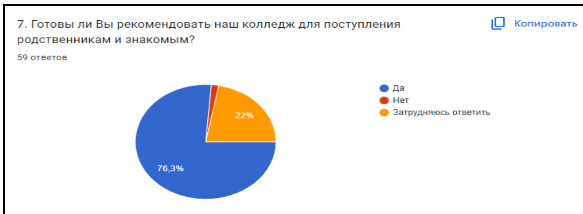
Диаграмма 7. Готовы ли Вы рекомендовать наш колледж для поступления родственникам и знакомым?

Вывод: 76,3% преподавателей готовы рекомендовать колледж для поступления родственникам и знакомым.