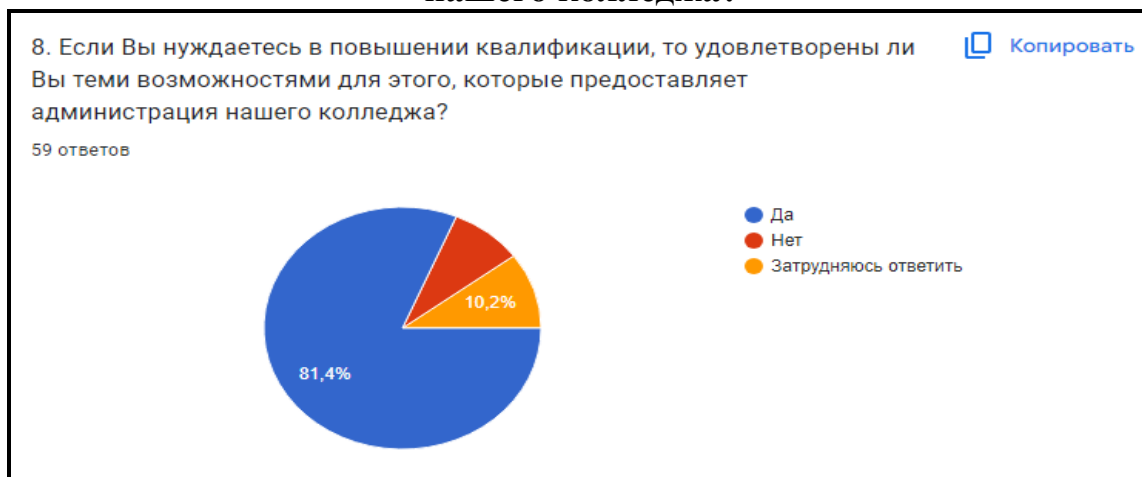
Диаграмма 8. Если Вы нуждаетесь в повышении квалификации, то удовлетворены ли Вы теми возможностями для этого, которые предоставляет администрация нашего колледжа?

Вывод: 51,4% преподавателей удовлетворены теми возможностями, которые предоставляет колледж.