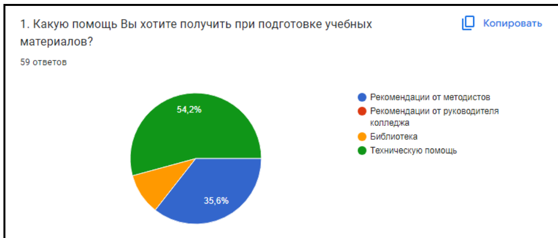
Диаграмма 1. Какую помощь Вы хотите получить при подготовке учебных материалов?

Вывод: наибольший процент выбора получили два критерия – «Техническая помощь» - 54,2% и «Рекомендации от методистов» – 35,6%