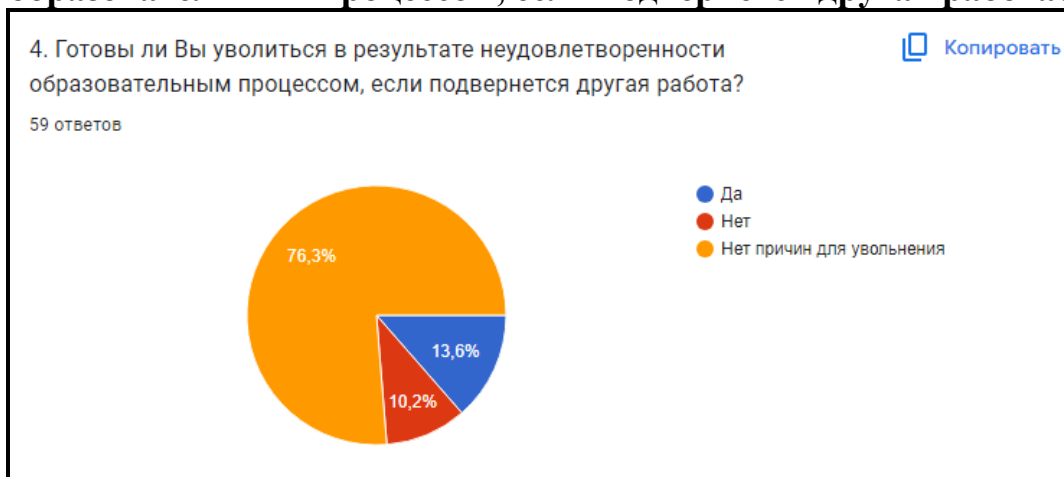
Диаграмма 4. Готовы ли Вы уволиться в результате неудовлетворенности образовательным процессом, если подвернется другая работа?

Вывод: большинство (86,5%) удовлетворены образовательным процессом и не собираются переходить на другую работу из СПб ГБПОУ «ККМ»