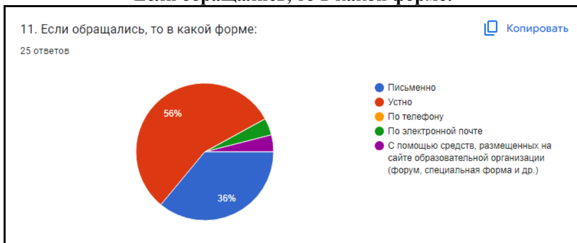
Диаграмма 12. Если обращались, то это было: