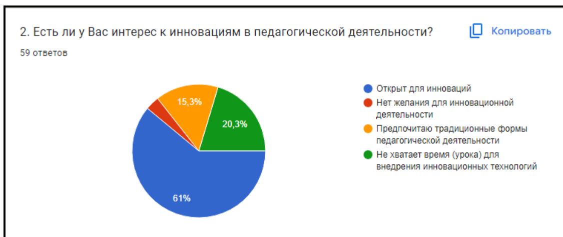
Диаграмма 2. Есть ли у Вас интерес к инновациям в педагогической деятельности?

Вывод: больше половины преподавателей готовы к освоению новшеств и включают в свою педагогическую деятельность инновационные технологии, 20,3% преподавателей считают, не хватает время (урока) для внедрения инновационных технологий.