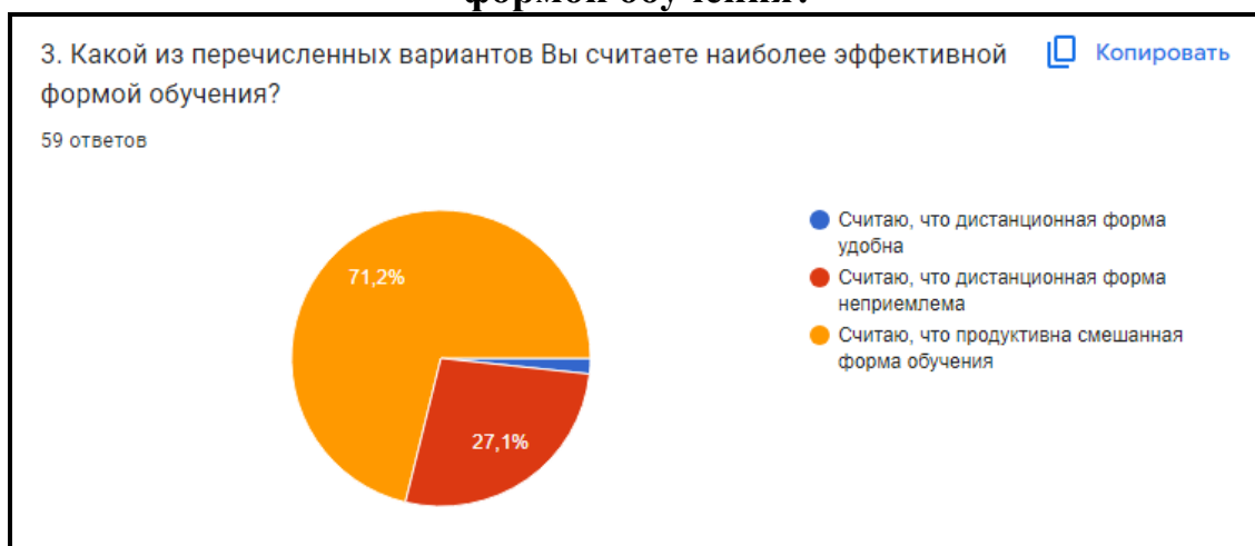
Диаграмма 3. Какой из перечисленных вариантов Вы считаете наиболее эффективной формой обучения?

Вывод: 71,2% преподавателей считают, что смешанная форма обучения более эффективна в современных условиях, а 27,1% преподавателей считают, что дистанционная форма обучения неприемлема