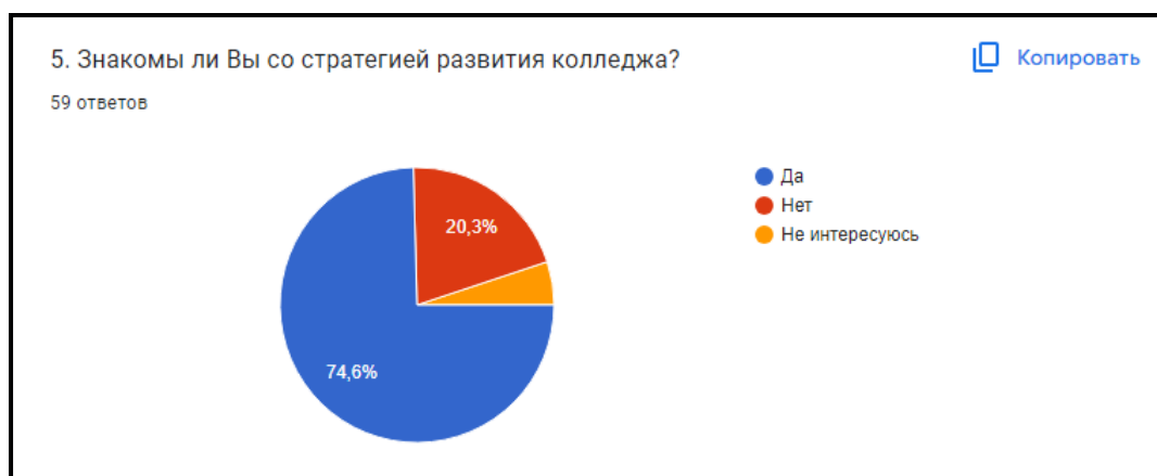
Диаграмма 5. Знакомы ли Вы со стратегией развития колледжа?

Вывод: 74,6% преподавателей знакомы со стратегическими целями колледжа, а 25,4% - нет